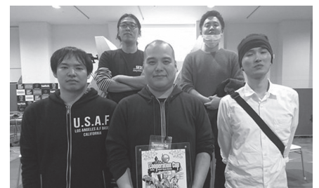
(前回覇者「天下のユン」)

【予選：7/プレーオフ：1】 2次予選1位通過7チーム+プレーオフ通過1チーム計8チームによる1発トーナメント戦。(台数は進行状況を見て対応となります。)試合前の抽選はK-1方式です。